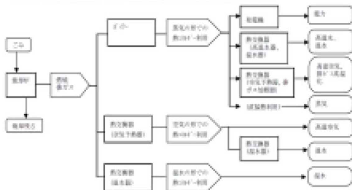
図1 廃棄物焼却処理における全熱利用の方法